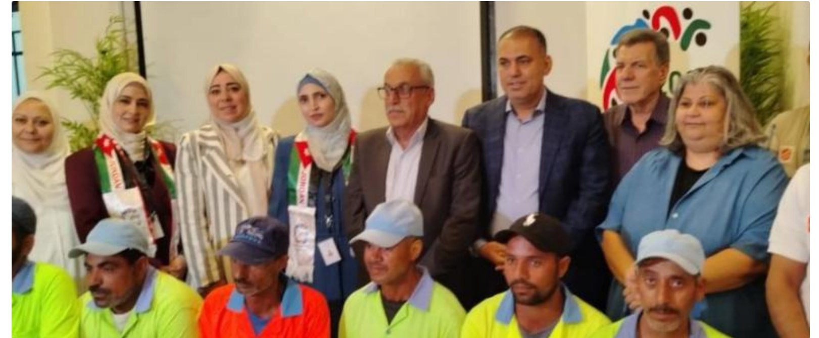
مبادرة تكريم عمال الوطن