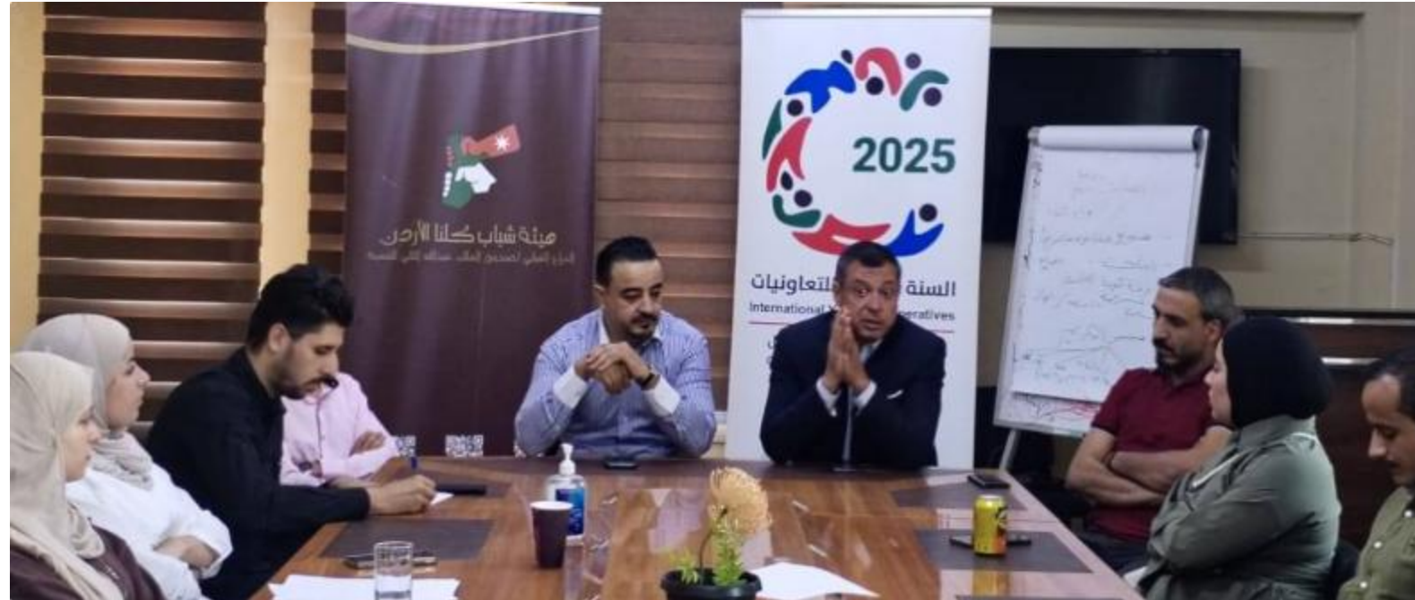
تنظيم (30) ورشة توعية للمجتمعات المحلية للتوعية بأهمية التعاونيات